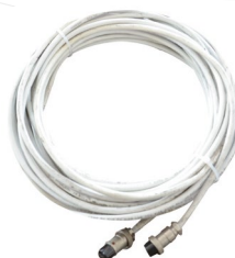
CAVO SEGNALE ATS 15 M